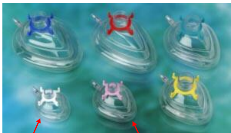
Branca neonato 1277